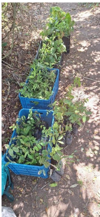
Figura 3 – 250 Mudas separadas para plantio em seu local definitivo no Morro das Andorinhas.