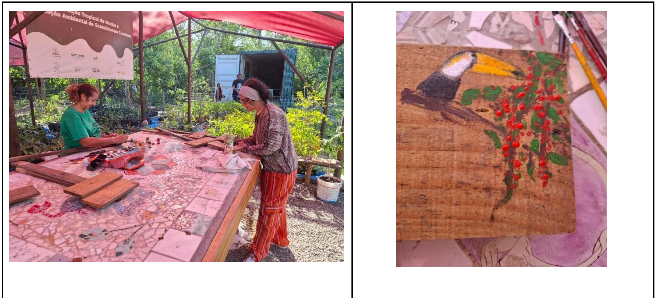
Figura 5 – Confeção de placas para afixar no Espaço Colibris. 24/10/2025.