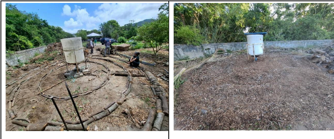
Figura 13 – Etapas da preparação da horta em mandala. Captação de água no centro e círculos concêntricos em troncos (esquerda). Solo revirado e material picado distribuído sobre a área (direita).

Início da montagem definitiva da horta medicinal em formato de mandala. A horta em mandala corresponde a um modelo de produção agroecológica que utiliza canteiros circulares para otimizar o uso do espaço e promover a diversificação de culturas. Neste mês a mandala ganhou seu desenho definitivo, com ponto de captação de água, roletes e troncos para desenhar os círculos, e a terra afogada recebeu material picado.