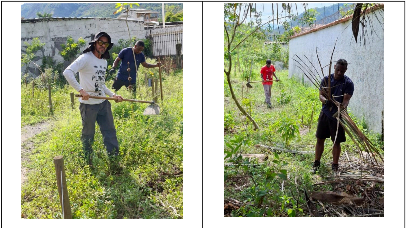
Figura 1- Mutirão de manutenção e plantio. Espaço Colibris. 14/10/2025