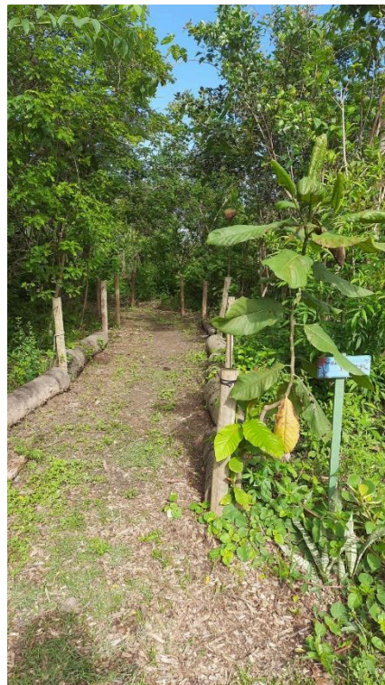
Figura 2 – Entrada do Espaço Colibris -21/10/2025.