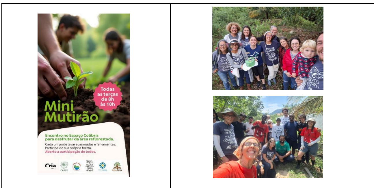
Figura 7 - Mini Mutirões das terças feiras, no Espaço Colibris.

7 de outubro de 2025 , 14 de outubro de 2025 , 21 de outubro de 2025 e 28 de outubro de 2025 .