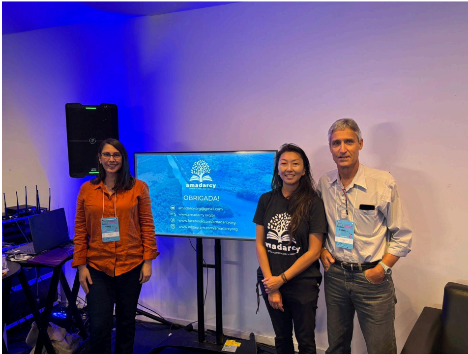
Figura 6 – Atividade durante a semana de ciência e tecnologia, 24/10/2025.