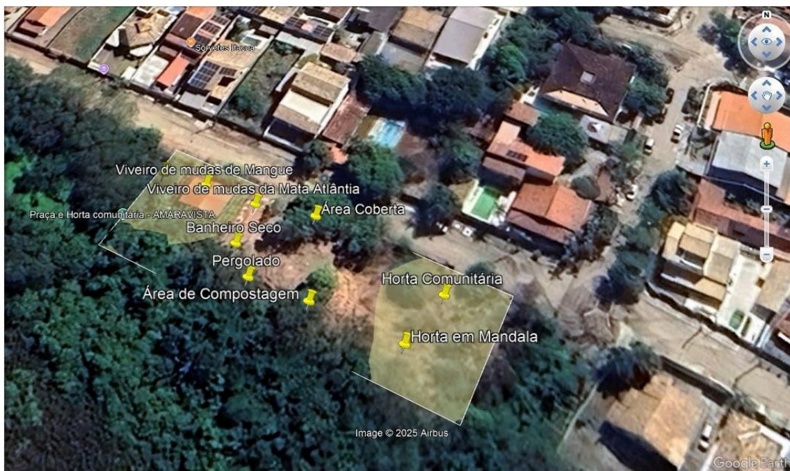
Figura 10 – Vista aérea da Estação Modelo.