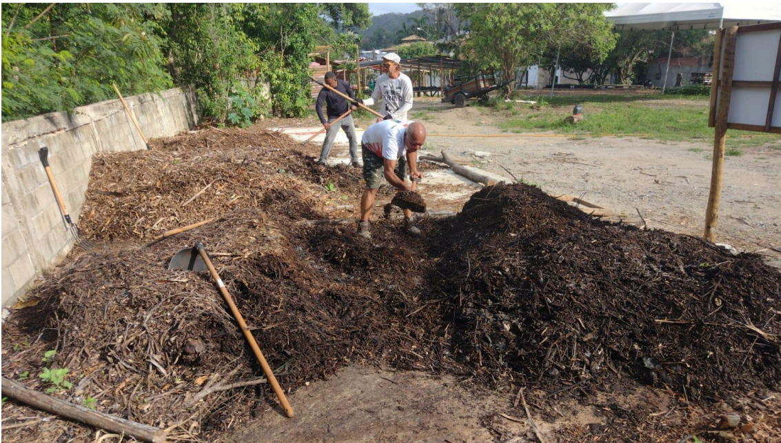
Figura 12 - Manutenção do composto orgânico, feito com resíduos de alimentos. 15/10/25

Continuidade do trabalho de alimentação da área de Compostagem (Figura 4). E o biofertilizante gerado na compostagem segue sendo usado no viveiro de mudas. O composto produzido com resíduos de alimentos da merenda escolar de três escolas (parceria com o Projeto Ressignifica) foi revirado e está quase pronto para seu primeiro uso como adubo nos canteiros.