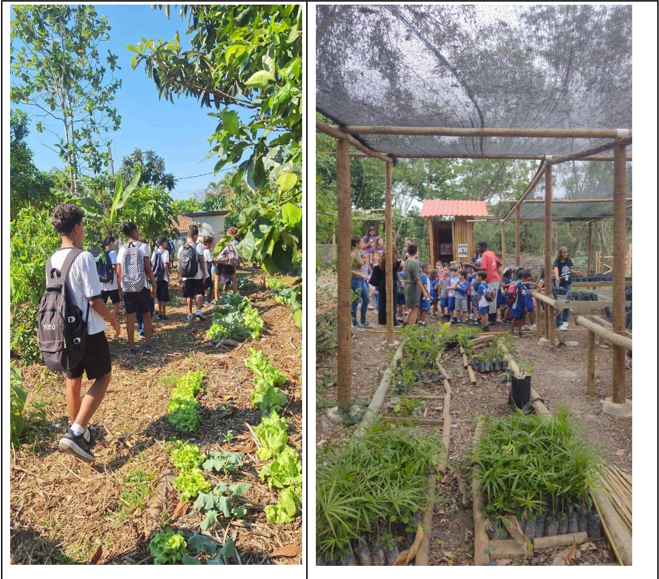
Figura 4 - Visita de diferentes escolas a horta e Viveiro de mudas. 6 e 7/10/2025.

https://www.instagram.com/p/DPjUVMIjqrG/?igsh=OTdyaHNtYjNpa2to