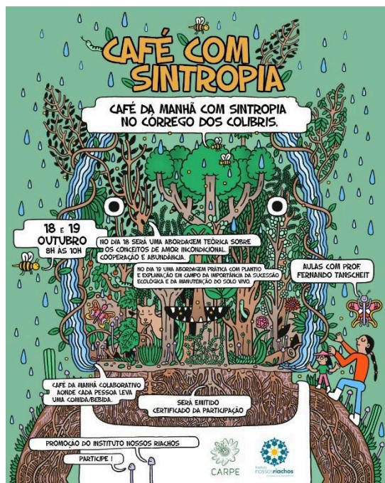
Figura 8 – Cartaz de divulgação do Café com sintropia, no Espaço Colibris.