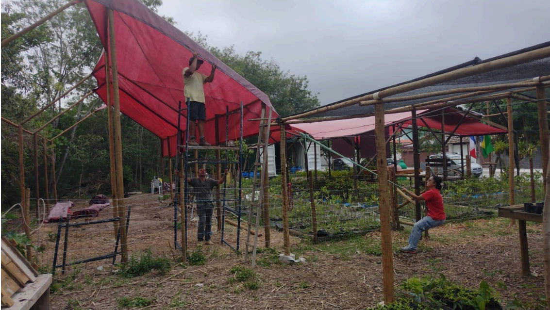
Figura 14 – Montagem da estufa de hidroponia. 14/10/2025.