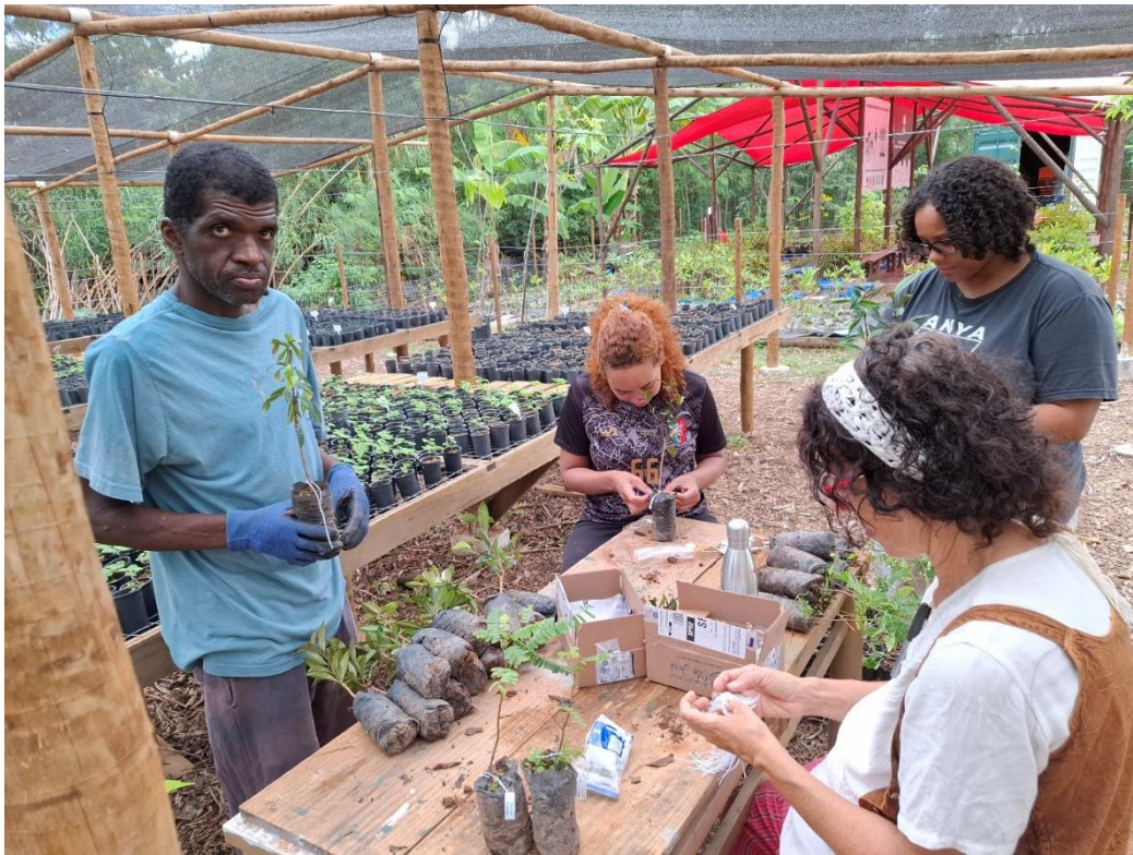
Figura 8- Colocação de etiquetas de identificação nas mudas já desenvolvidas e prontas para o plantio.