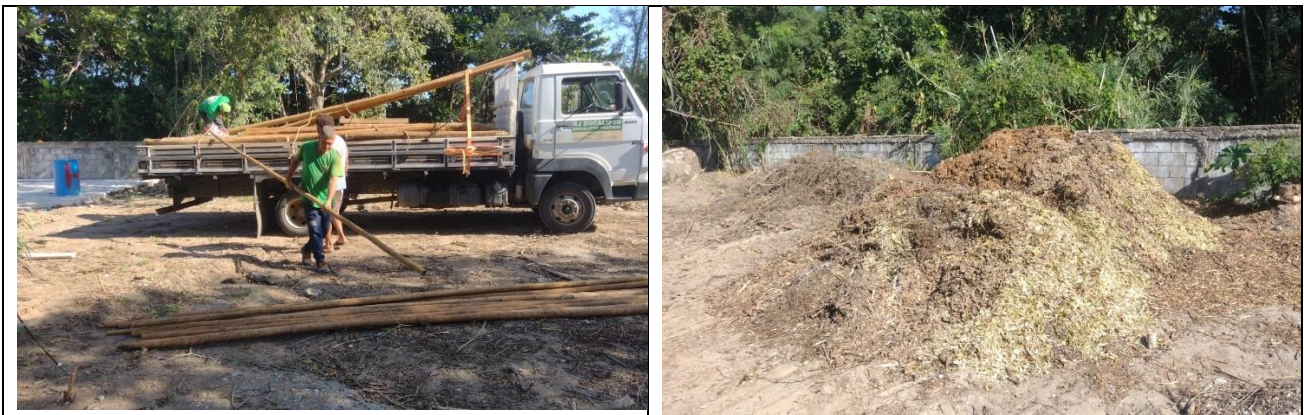
Figura 9- esquerda- recepção dos roletes de eucalipto tratado para montagem do pergolado. Objetivo plantio de trepadeiras e lianas, como chuchu, maracujá e parreira. Direita- Matéria picada para acondicionar no solo onde será o local de instalação do pergolado.