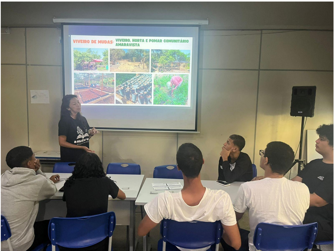
Figura 12- Estudantes do ensino médio do CIEP 448 recebem aprendizado sobre o viveiro.

As atividades de campo no Morro das Andorinhas e Morro da Peça contaram com a expertise dos agrofloresteiros do grupo parceiro CARPE e voluntários com ensinamentos sobre a técnica de plantio e manutenção das áreas.