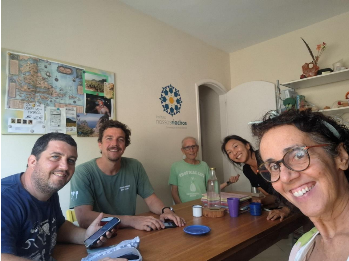
Figura 19- Núcleo do projeto em reunião de alinhamento das atividades mensais.

Reunião de alinhamento da equipe realizada no início de junho.