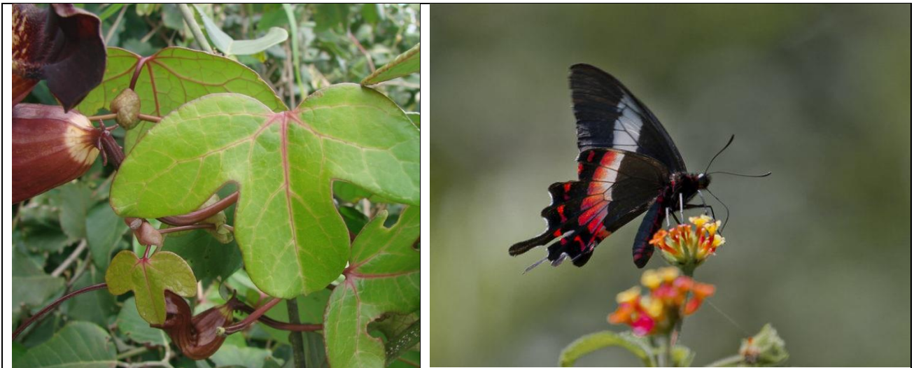
Figura 3- Jarrinha da praia e a borboleta da restinga. Interação inseto planta.

Uma novidade foi encontrar uma planta trepadeira nativa, a jarrinha da praia, Aristolochia trilobata , que serve de alimento para as lagartas da borboleta da restinga. Esta borboleta foi a primeira do Brasil a ser incluída na lista de animais invertebrados ameaçados de extinção, devido à perda de habitat e à sua dieta especializada. Estabelecer um vínculo entre as espécies animais que habitam a mata ciliar e o alimento de que necessitam para ali viver, é um diferencial nesta etapa do projeto (Fig. 1).