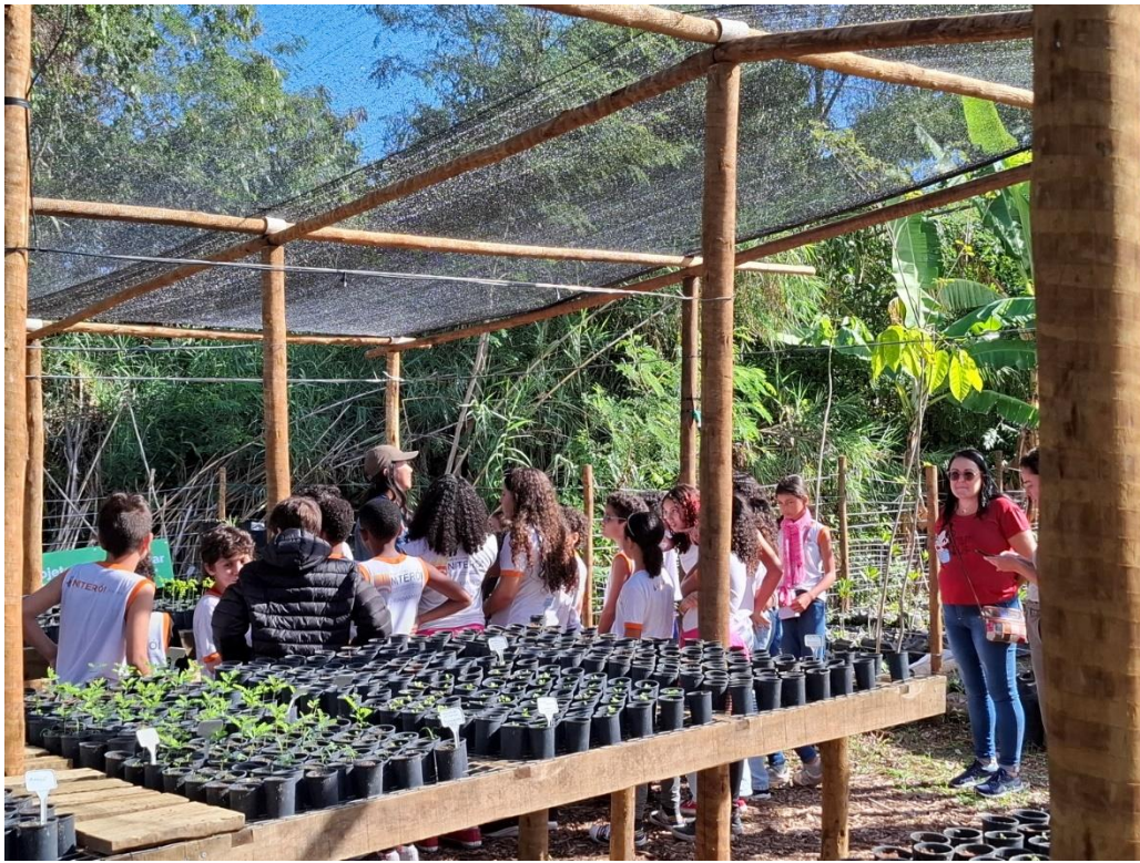
Figura 11- Estudantes da Escola Marcos Waldemar em visita ao Viveiro de Mudanças.

Continuidade das atividades entre o Programa PESA (Programa de Educação Socioambiental) e a Amadarcy (Detalhado no Relatório 3). A Escola Municipal Professor Marcos Waldemar de Freitas é beneficiária da parceria nas etapas de plantio de mudas e também saídas de campo em trilha interpretativa no Morro das Andorinhas.