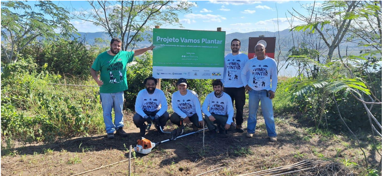
Figura 14- Placa de sinalização no Morro das Andorinhas. Equipe e voluntários receberam o uniforme do projeto.