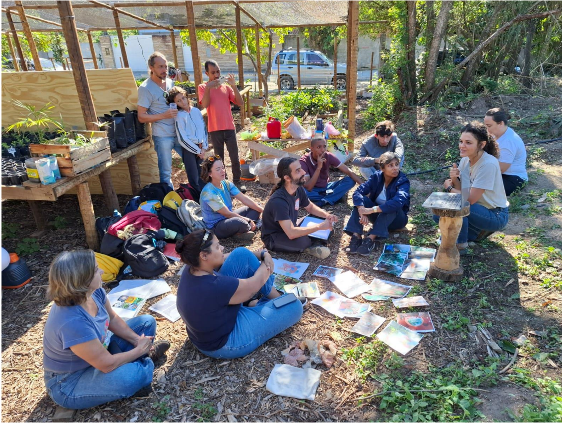
Figura 18- Oficina aberta ao público sobre permacultura e ciclagem de materiais.