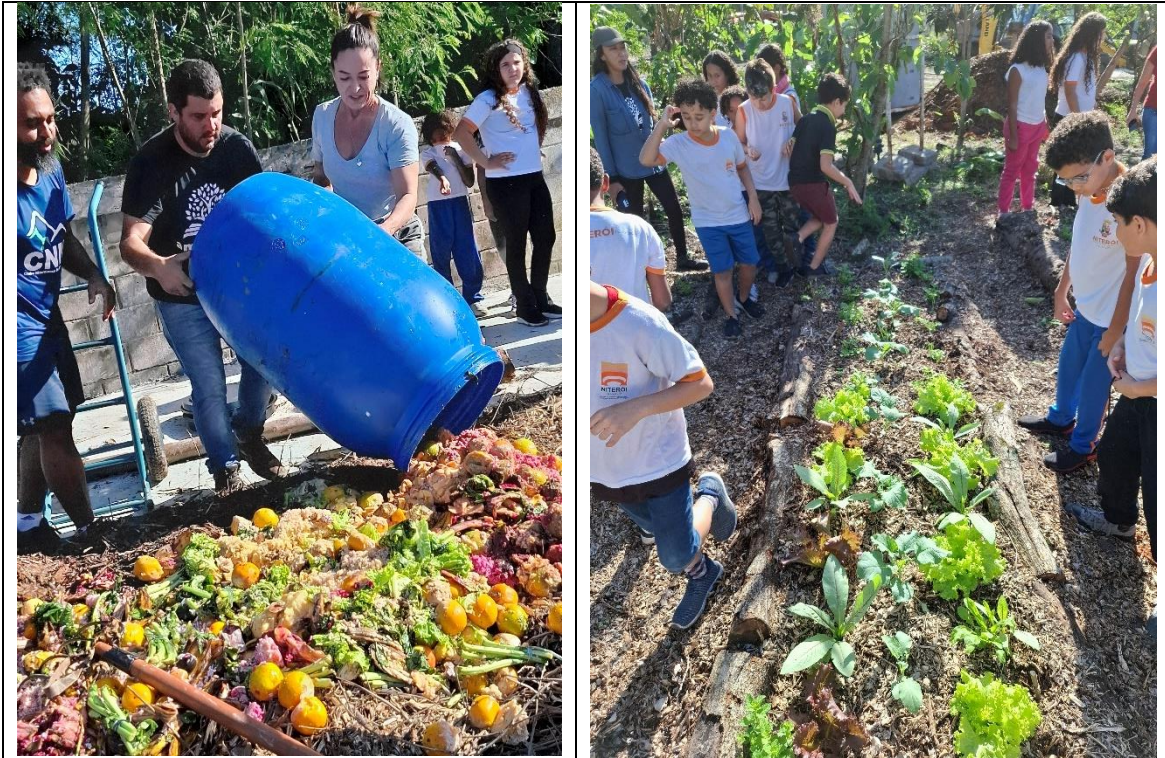
Figura 13- Estudantes acompanham o processo de compostagem dos resíduos orgânicos de uma semana de merenda escolar, e a adubação da horta com o composto gerado após o tempo de decomposição. E.M. Dário Castello. 13/6/2025.

Atividade de campo -Compostagem com escolas do bairro- divulgada em: