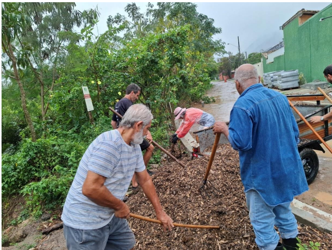
Figura 1- Matéria picada distribuída no acesso ao Espaço Colibris.

Foi continuado o trabalho de limpeza e cobertura com material picado nas três áreas de reflorestamento e nas áreas do viveiro e da horta comunitária. Executados 62,5% do proposto.