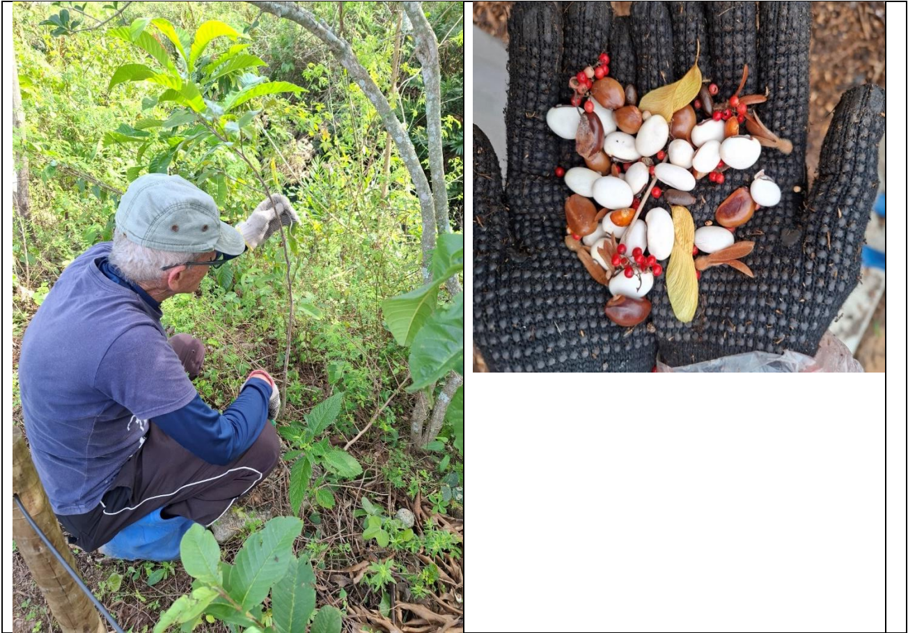
Figura 2- Manutenção no Espaço Colibris. Poda e plantio da muvuca de sementes sob os ninhos já prontos.

Mini Mutirão. O Coletivo Córregos da Tiririca promove um mini mutirão por semana na área do Espaço Colibris. Neste mês foi realizado um em 3 de junho de 2025 com trabalhos de limpeza, poda e plantio de mudas ( http://nossacasa.net/nossosriachos/tiririca/mini-mutirao-20250603/ ). O segundo em 10 de junho foi cancelado por fortes chuvas. O terceiro em 17 de junho de 2025, com trabalhos de limpeza, poda e plantio de 28 mudas de espécies nativas( http://nossacasa.net/nossosriachos/tiririca/mini-mutirao-20250617/ ). O quarto em 23 de junho, feriado municipal, com o plantio de 15 mudas de espécies nativas ( http://nossacasa.net/nossosriachos/tiririca/mini-mutirao-20250624/ ).