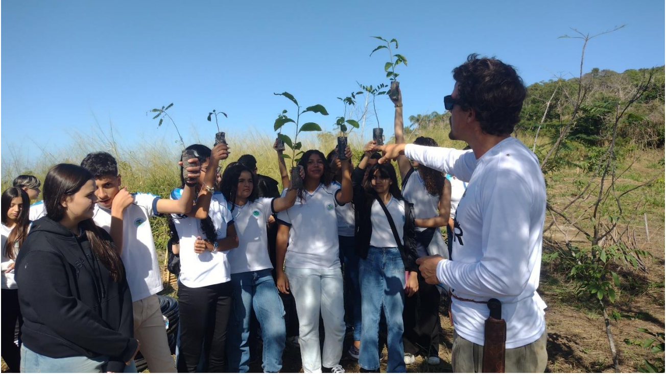
Figura 5- Morro das Andorinhas. Estudantes recebem ensinamentos sobre o ecossistema e recebem mudas para plantar.

23 e 25/6- Mutirão como grupo da Carpe. Para fazer o reflorestamento é preciso material orgânico. A proteção do solo acontece a medida em que o material da poda fica disponível e é espalhado no solo. A cobertura do solo no platô onde acontece o plantio em Andorinhas tem funções de proteger o solo contra lixiviação, ou seja, a lavagem da camada superficial em caso de chuvas abundantes. Também retém a umidade do solo, protegendo contra insolação forte, funcionando como um chapéu de palha, que nos protege do sol intenso. Já ressaltamos em relatórios anteriores que a área nomeada “andorinhas fogo” é alvo de recorrentes incêndios florestais. As medidas em que as condições do ambiente se transformam e retém maior umidade, esses episódios devem diminuir.