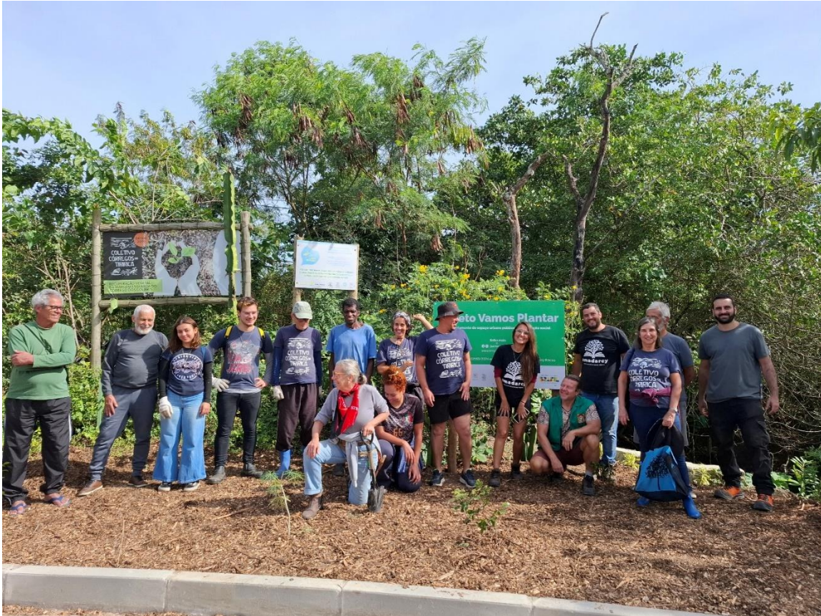
Figura 16- Mutirão de plantio no córrego dos Colibris e fixação da placa de sinalização da área.

Mutirão Comunitário no Espaço Colibris- Foi realizado um mutirão comunitário na área dos Colibris. Executado 55,6% do proposto.