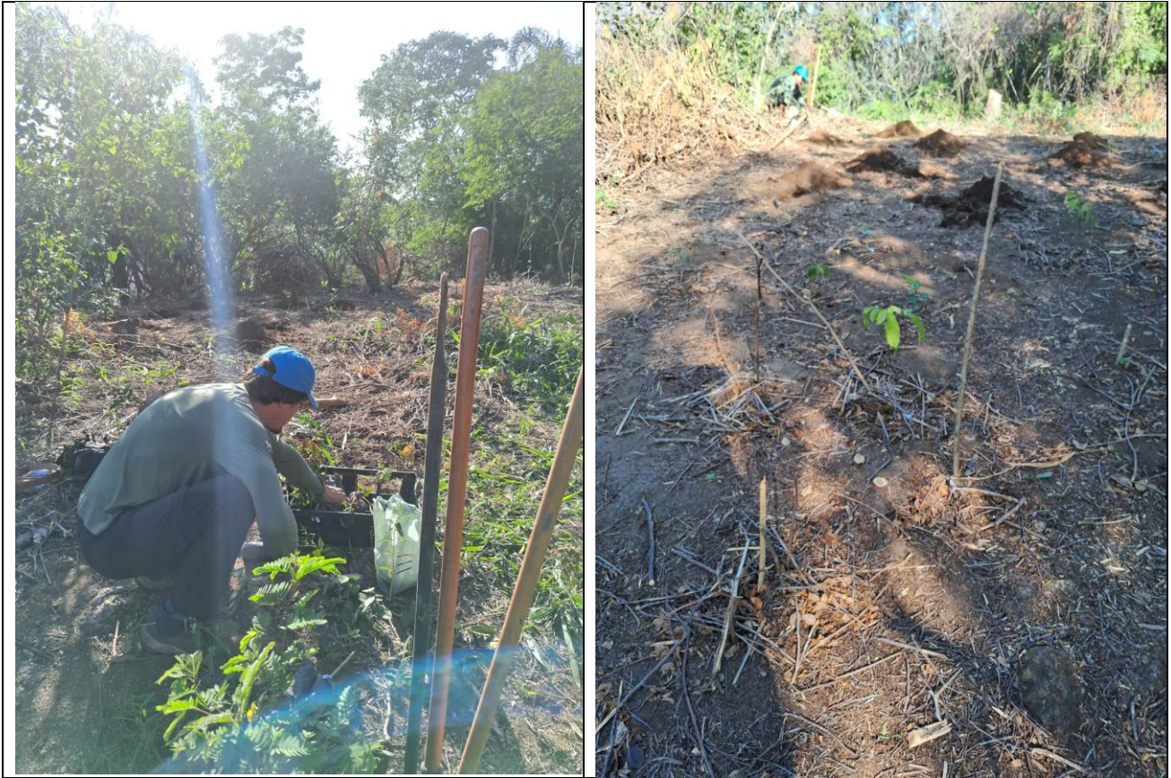
Figura 7- Preparação de ninhos e Plantio de mudas no Morro da Peça. 30/6/ 2025.