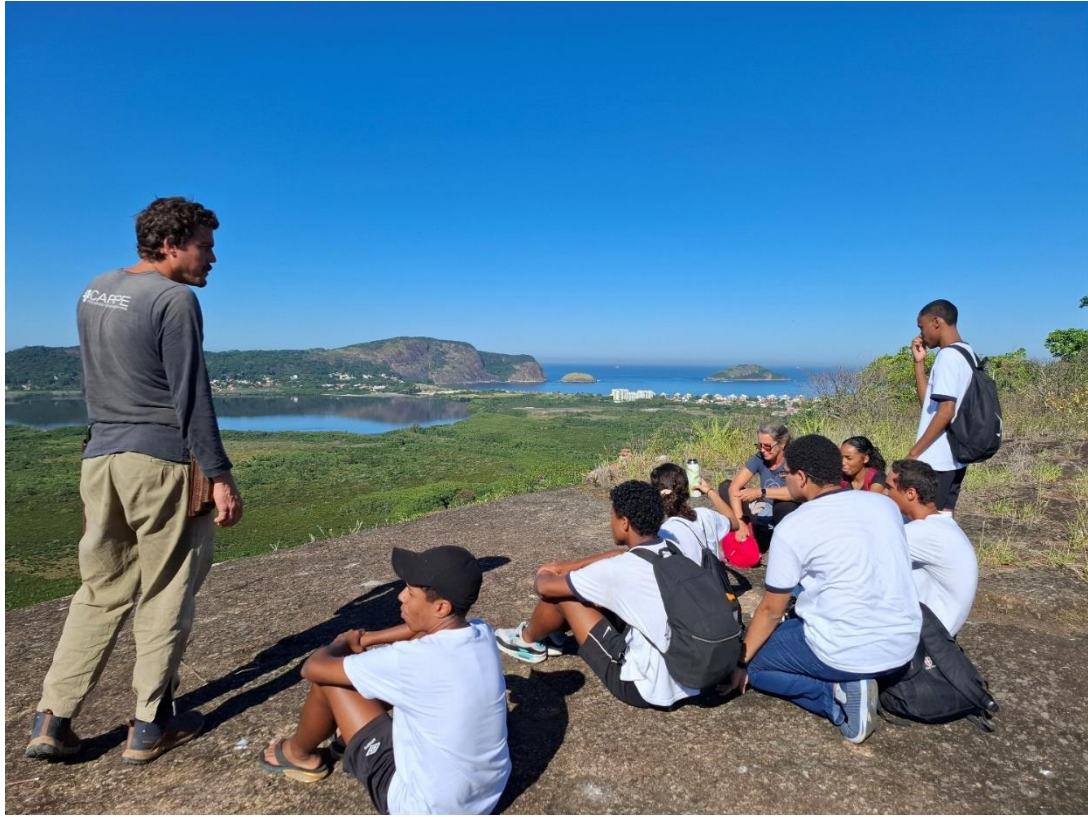
Figura 6- Visita de campo ao Morro da Peça com a turma do ensino médio do CIEP 448.