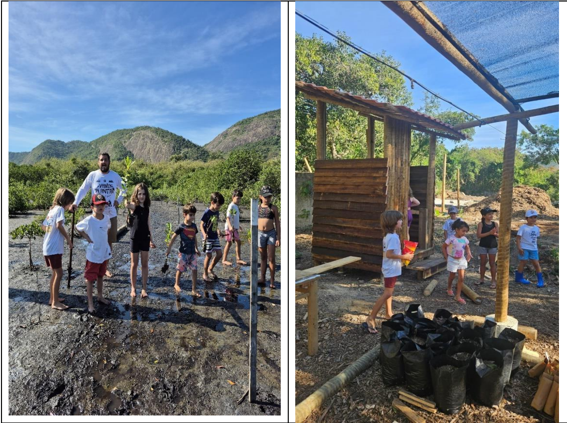
Figura 10- Vivência com estudantes e pais da Escola Me Ninar. Visita ao viveiro de Mudanças, plantio e atividades educativas. Nível: pré- escolar. 29/6/2025.

Etapa 2 - Realização das atividades de educação ambiental, serviço de terceiros e divulgação do projeto.