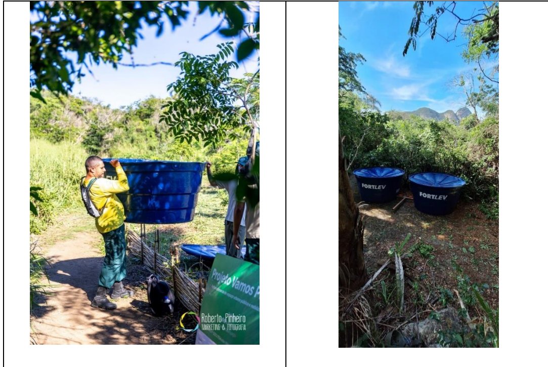
Figura 7 – (a) colocação das caixas d’água- 21/5/2025, e (b) já instaladas no topo do morro produzindo água na área de plantio- 27/5/ 2025.