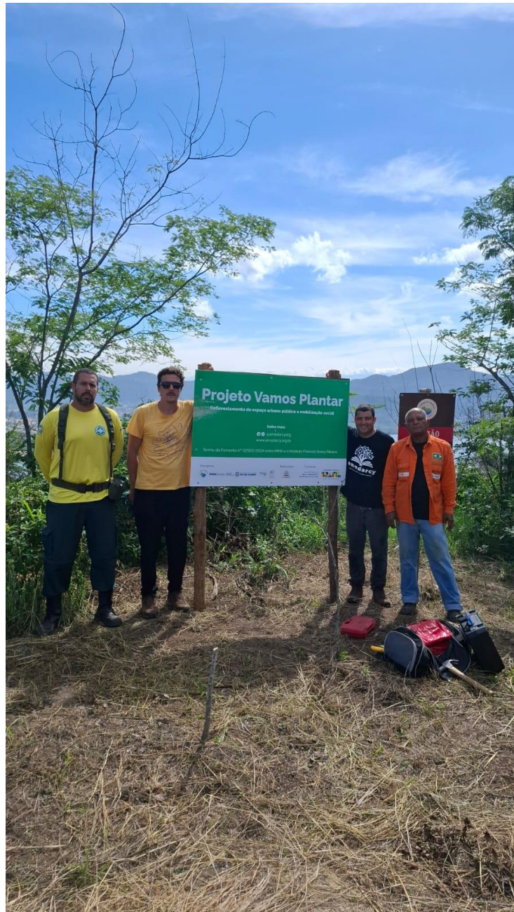
Figura 19 - Placa de sinalização fixada.