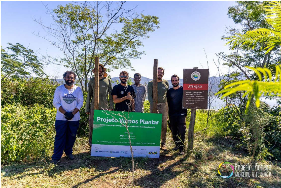
Figura 18 - Placa de sinalização no Morro das Andorinhas.