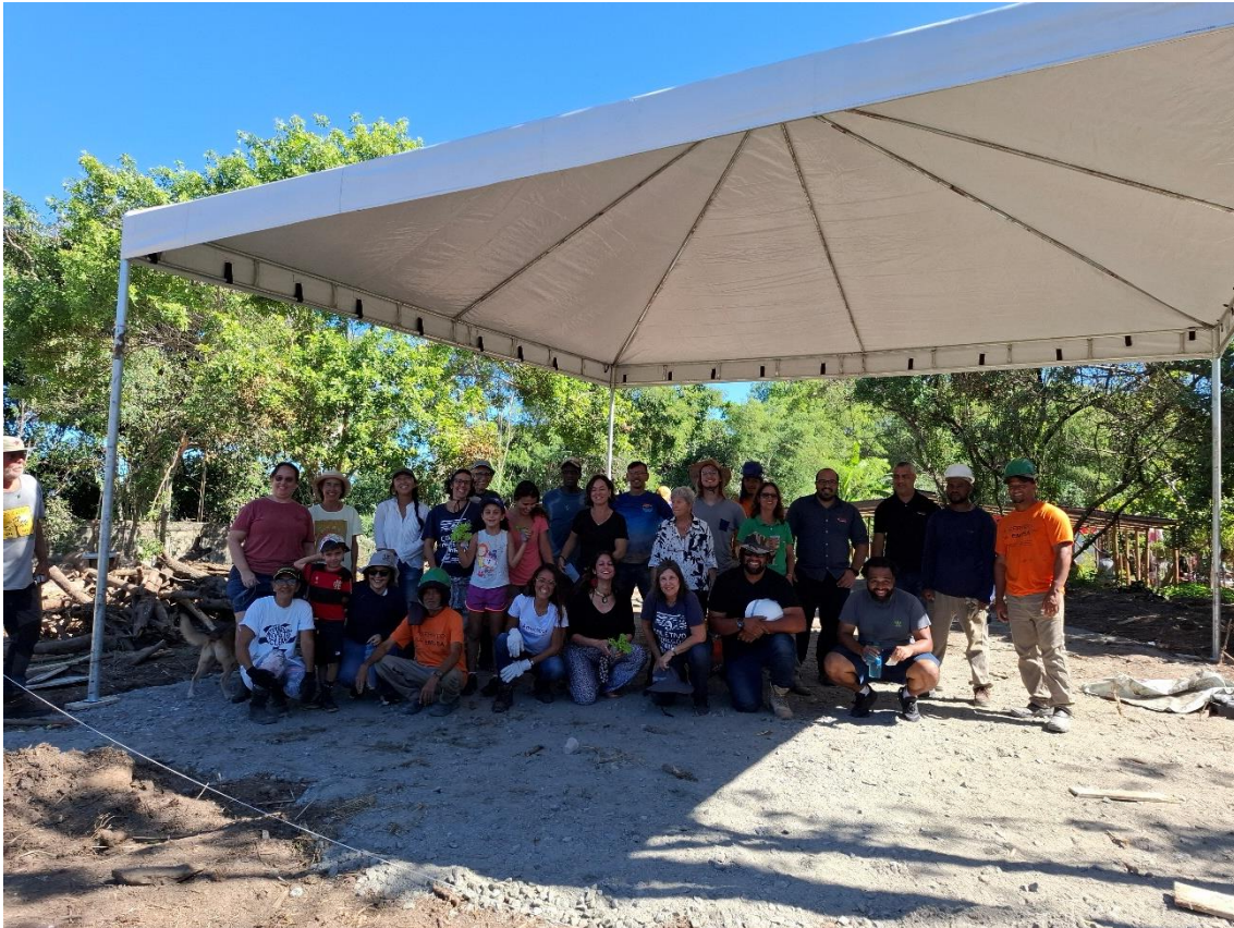
Figura 22 – Equipe de trabalho na horta e tenda que funcionará como área de convivência para atividades educativas.