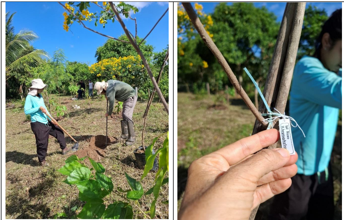
Figura 5- Plantio de mudas já crescidas no córrego dos Colibris. 7/5/2025.