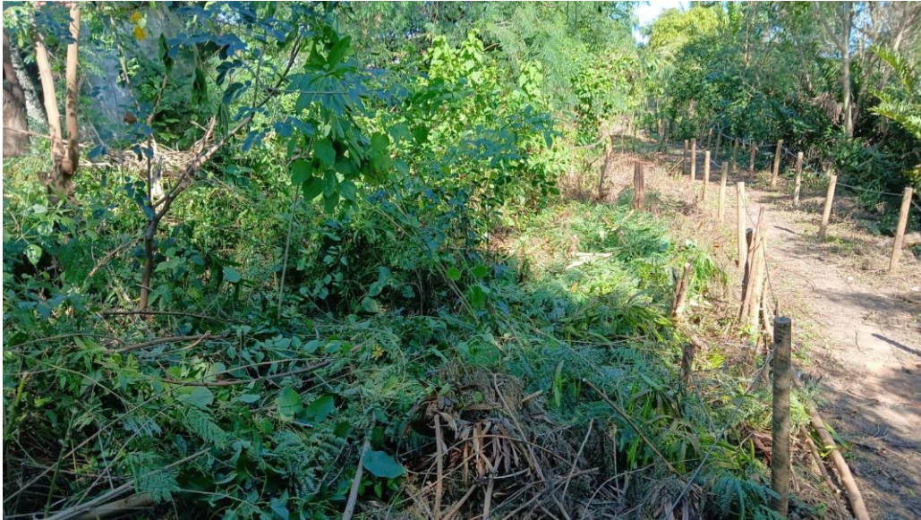
Figura 4- Delimitação do caminho de acesso ao espaço colibris com cabos de aço.