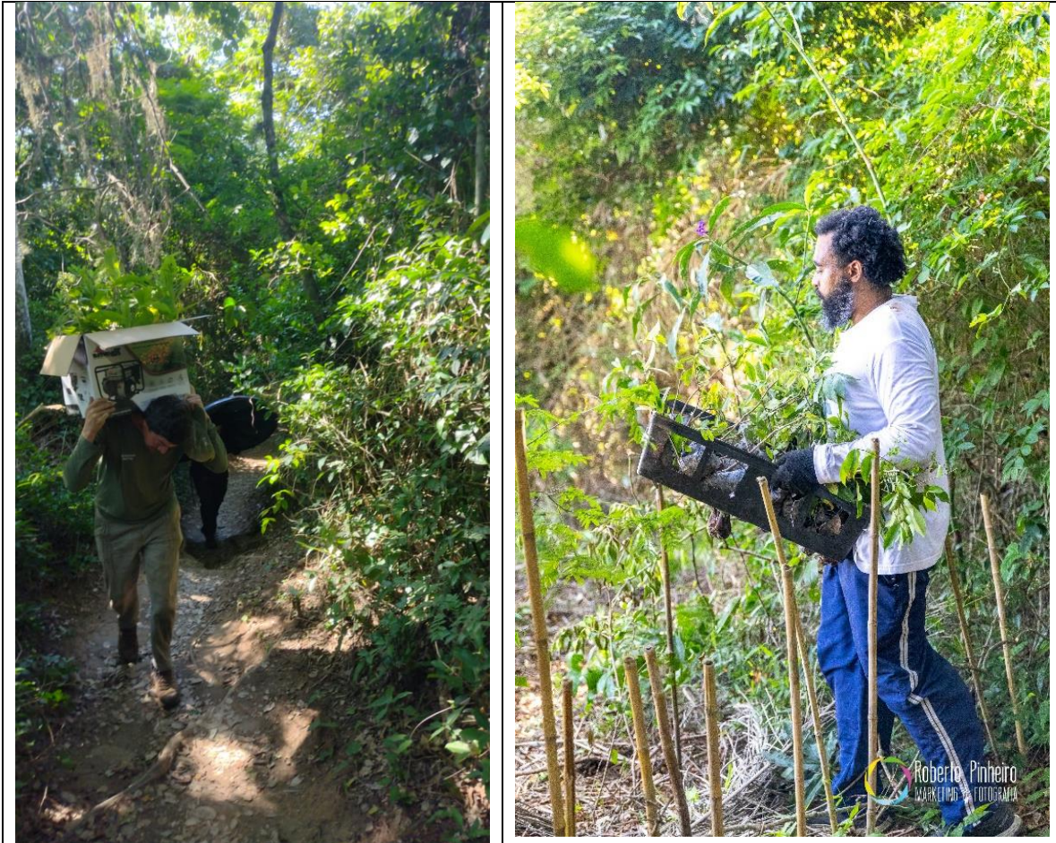
Figura 8- Subida dos equipamentos de trabalho e distribuição das mudas no morro das Andorinhas. 22/5/ 2025.