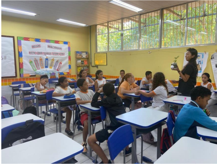
Figura 15- Atividade educativa na escola municipal Marcos Waldemar - em parceria com o PESA/MAI- 23/5/2025.