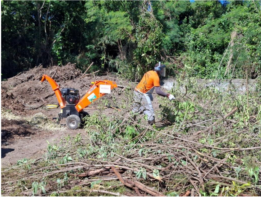
Figura 13- Mutirão no Viveiro de mudas. Picadeira cedida ao projeto por empresa parceira produzindo matéria picada no próprio local para proteção do solo.

horta comunitária AMaravista será destinada a compostagem de resíduos orgânicos com minhocas, para produção de adubo natural.