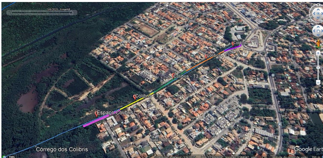
Mapa 1 – Subdivisão revisada da área de recuperação vegetal da margem esquerda do Córrego dos Colibris.

Foi revisado, pela equipe da Carpe, o zoneamento e georreferenciamento da área - A mata ciliar da margem esquerda do Córrego dos Colibris foi subdividida em quatro trechos para efeitos do Projeto (mapa 1): Colibris-T1 com 103,7 m; Colibris-T2 com 191,3 m; Colibris-T3 com 152,9 m, Colibris- T4 com 125,7 m e Espaço Colibris = 1.796 m 2 de área e 355 m de perímetro.