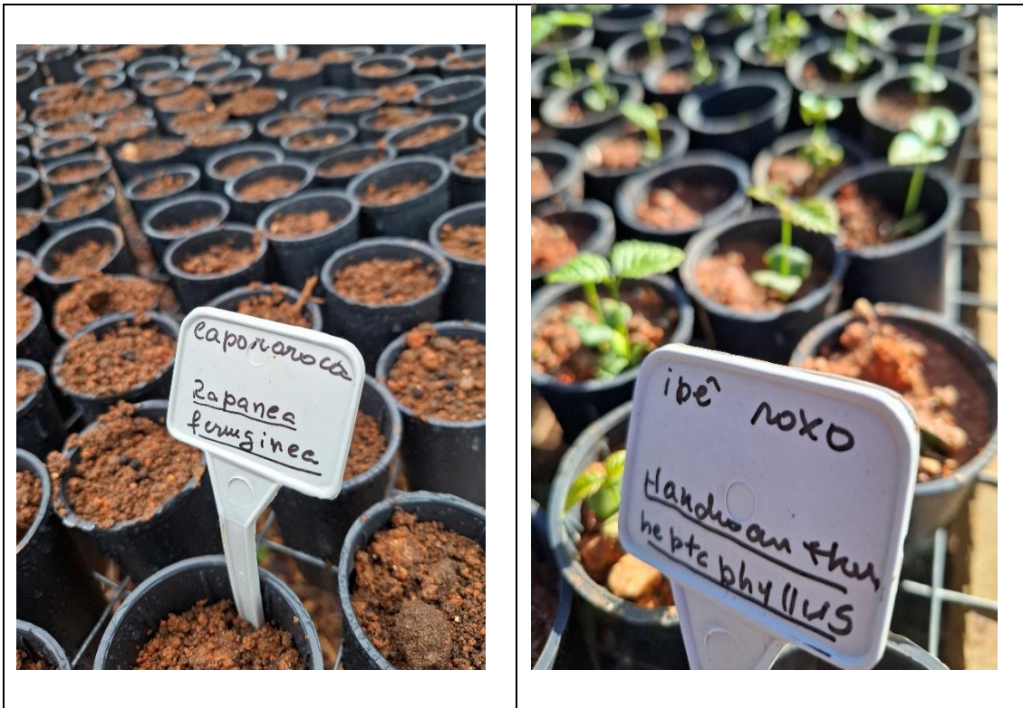
Figura 12- Mudas plantadas em tubetes- plantio- 6/4/ 2025. Muda germinando- 17/5/2025.