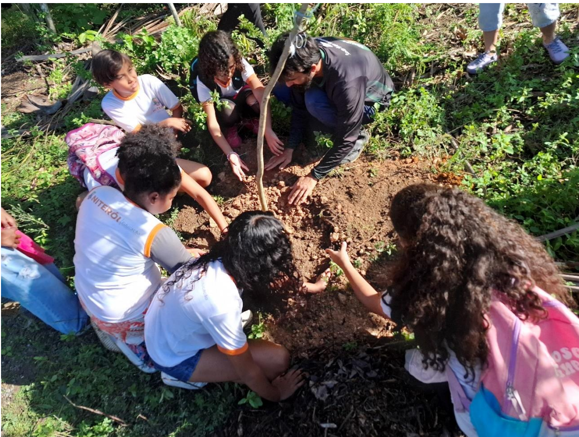
Figura 1- Envolvimento dos jovens na montagem de um dos ninhos. 30/4/2025.

No dia 30/04, os alunos da escola participaram do plantio (Figura 1).