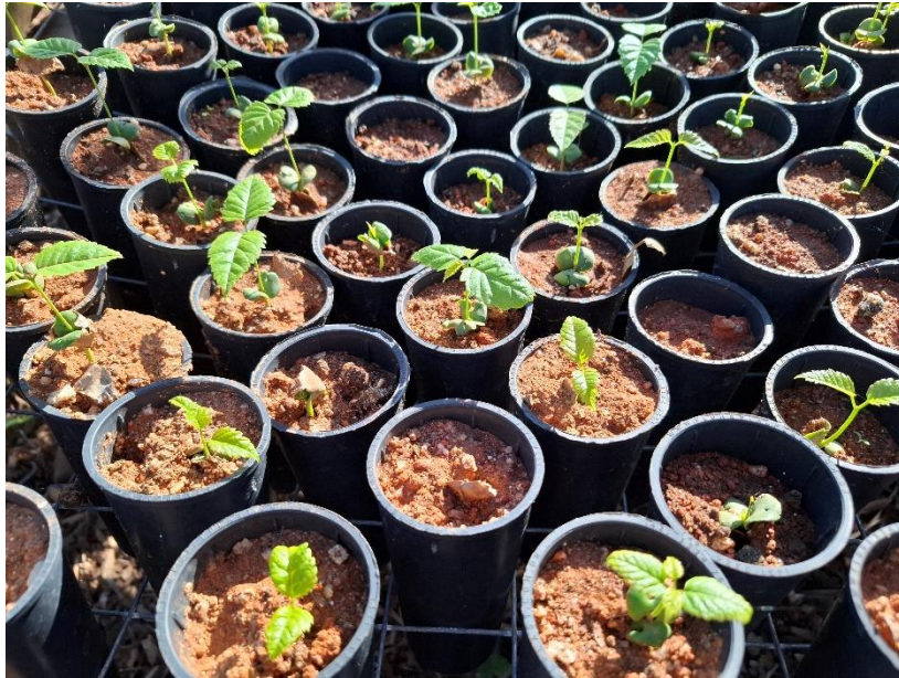
Figura 21 – Mudas germinando no viveiro.