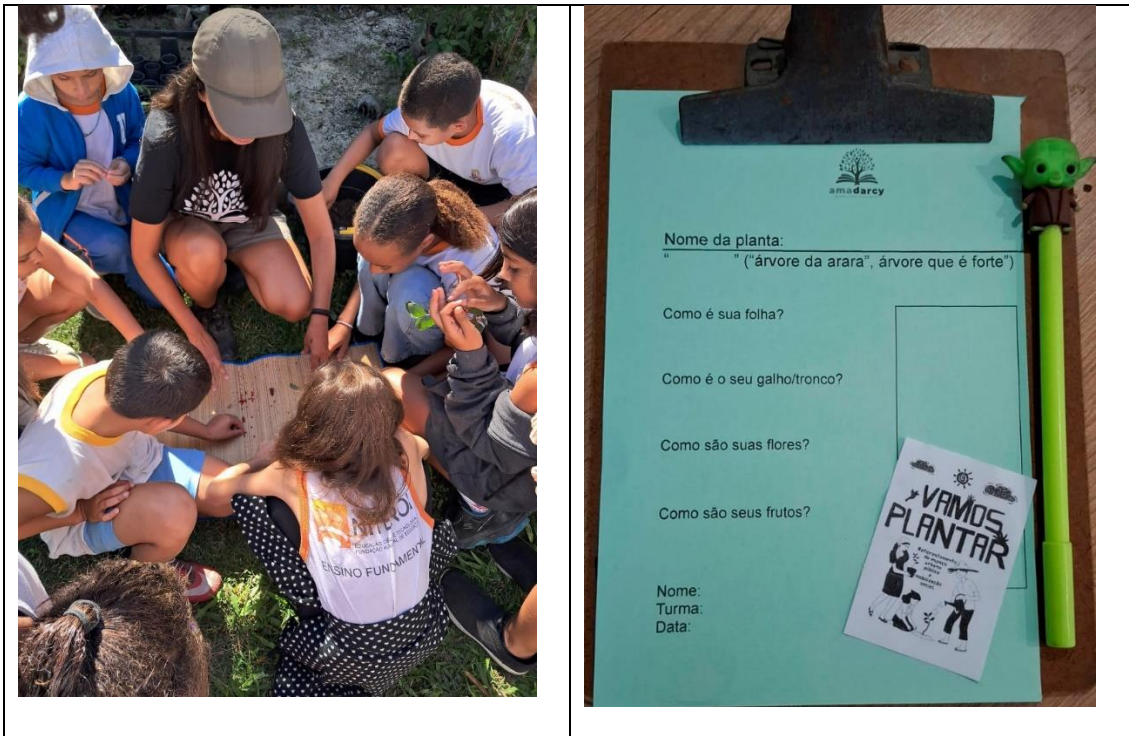
Figura 17 – Visita de campo com a escola Marcos Waldemar ao Museu de Arqueologia de Itaipu- MAI- 20/5/ 2025.