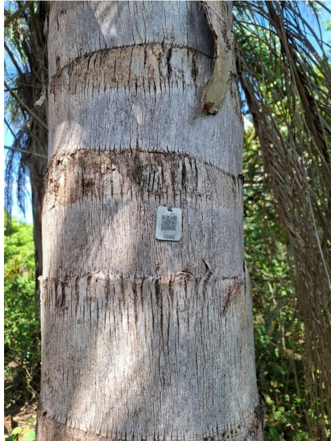
Figura 3- Palmeira Jerivá. Tags de identificação das árvores na mata ciliar do córrego dos Colibris.

catalogadas. Foi gerado um código QR para cada uma delas visando a sensibilização (Figura 3).