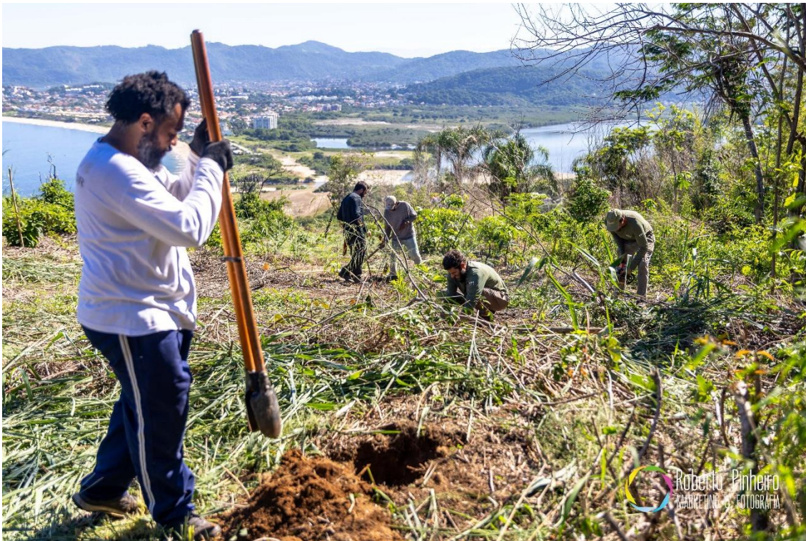
Figura 9- Montagem dos ninhos pela equipe de trabalho.