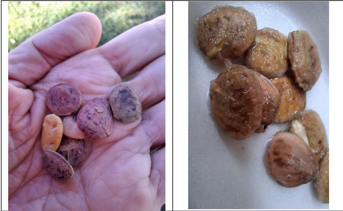
Figura 10 - Quebra de dormência das sementes- Pau Brasil. A. Recém colhidas. B. após 24 horas de hidratação.