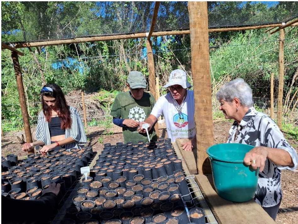
Figura 11 - Mutirão de semeadura no viveiro. 17/5/25.