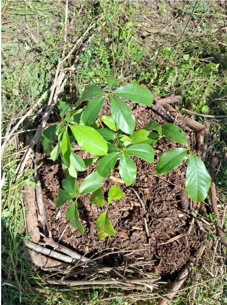
Figura 2- Montagem de ninho com mudas de espécies nativas e aproveitamento da matéria picada e galhos para enriquecimento do solo.

incorporando sementes para enriquecimento do solo, fechando com matéria picada e galhos (figura 2).