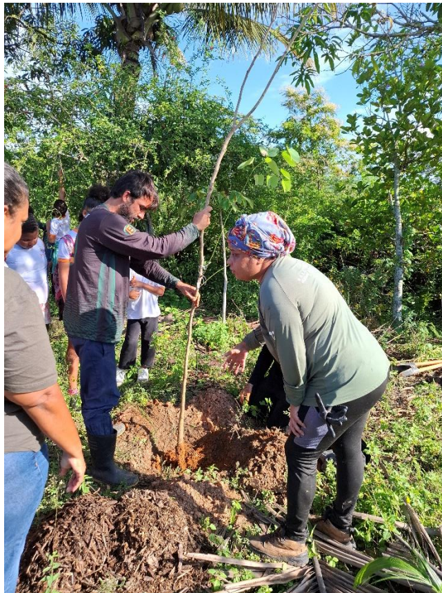
Figura 20- Mutirão de plantio de mudas grandes na área em recuperação no Espaço Colibris