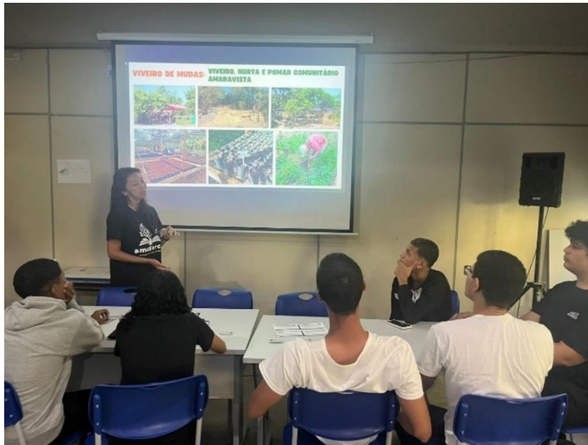
Figura 16 – Primeira atividade educativa com estudantes do ensino médio- no CIEP 448- Praça do Engenho do Mato- 26/5/ 2025.

A condução das turmas do ensino médio a visitas de campo ficou acordada de acontecer durante a semana de meio ambiente (5 de junho- dia mundial do meio ambiente ou em data próxima- a constar do próximo relatório).