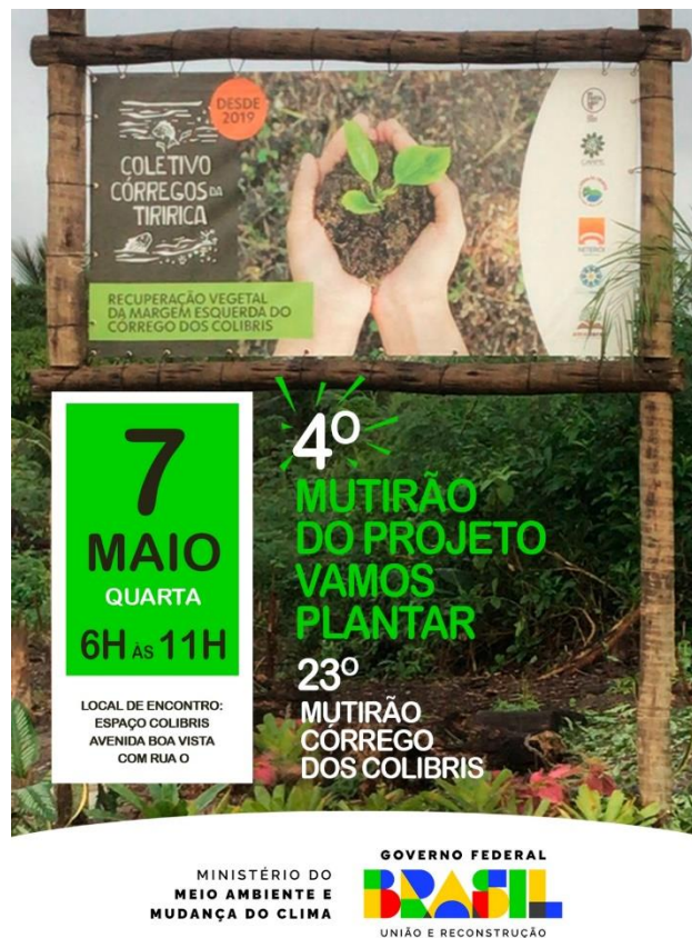
Figura 23– Chamada para mutirão com voluntários no córrego dos Colibris 7/5/ 2025.

Link para o post sobre o mutirão no viveiro e horta: https://www.instagram.com/reel/DJ9PqFJxFVI/?igsh=MXhzanRzbHhtbTlkYQ==